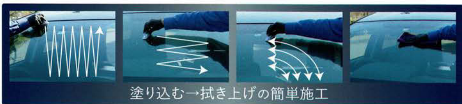
塗り込む→拭き上げの簡単施工

そのまま塗り込めるフェルト付きのアプリケーターは、1回使い切りタイプで手間いらず