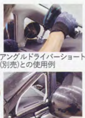
アングルドライバーショート(別売)との使用例